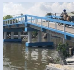
Cầu Bưu Điện, Cà Mau