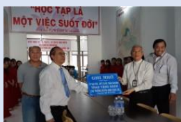
Trường CĐ Hòa Bình, Xuân Lộc, Đồng Nai