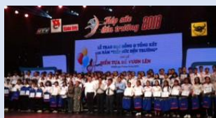
Tiếp sức đến trường