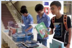
Trường CĐ KT Cao Thắng