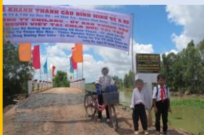
Cầu Bình Minh, Long An