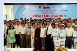
Điểm sáng ngành Y