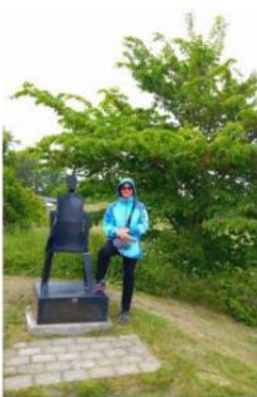
Laertes cứng người như một chiếc ghế khi chờ đợi con trai mình Odysseus