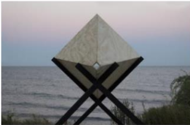
"And Back Again" - Monica Tormell ( http://www.monicatornell.nl/and-back-again/ )