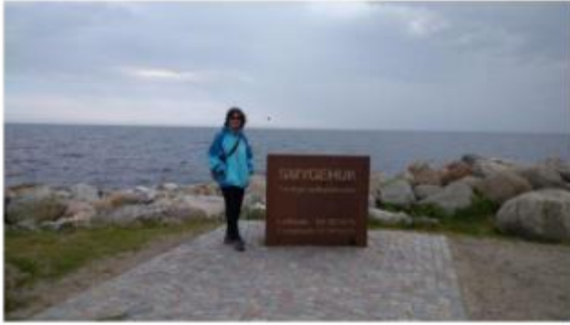
Địa điểm cực nam của đất nước Thụy Điển Smygehuk