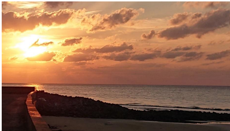
Nơi cực nam (mới) của tổ quốc, theo Google Maps (6)

„Khai Long được tạo hóa ban tặng cho một vị trí rất đặc biệt. Đứng ở bờ biển, khi bình minh ló dạng, du khách sẽ thấy mặt trời tròn như vành thúng chói đỏ nhô lên từ mặt biển phía đông, và khi chiều xuống, cũng ở vị trí ấy, ta lại thấy vàng kim ô vàng rực từ từ lặn xuống mặt biển phía tây“ (2).