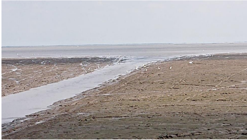
Đất được biển bồi (6)

Các cây đước đã xuất hiện, quyết bảo vệ đất bồi: