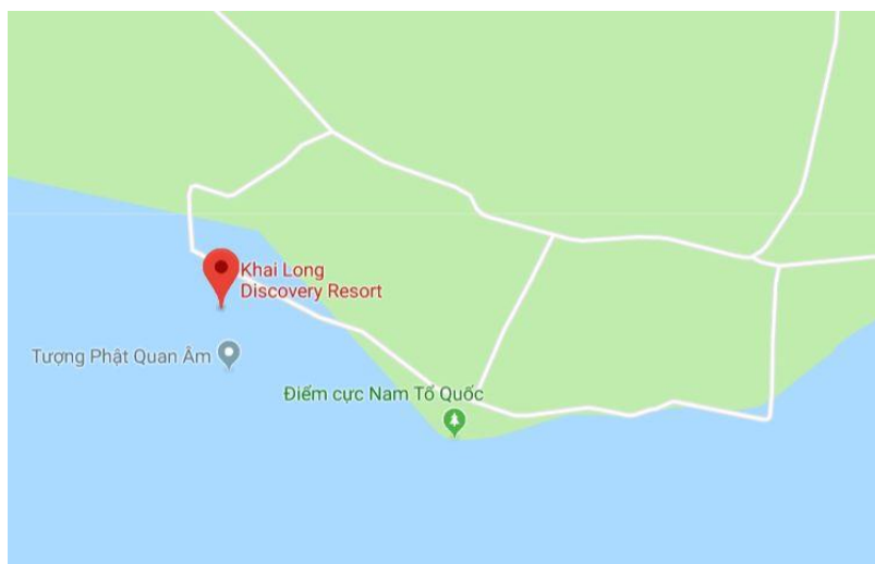
Khai Long và điểm cực Nam Tổ Quốc (4)

„Quan sát trên bản đồ rất dễ thấy mũi Cà Mau nằm ở vị trí chệch về phía Tây Nam thuộc bán đảo Cà Mau. Từ đây, bờ biển tiếp tục chạy xuống hướng Đông Nam, đến bãi Khai Long trước khi rẽ lên hướng Đông Bắc. Nếu thuần túy quan sát trên bản đồ thì có thể xác định điểm cực nam mới nằm ở một vị trí thuộc vùng đất bãi Khai Long“ (1), nơi chúng tôi nghỉ dưỡng. Nhìn kỹ lại bản đồ Google maps (xem ảnh dưới), chúng tôi phát hiện bãi Khai Long không nằm ở đất liền, mà là ngoài biển khơi (điểm đỏ trên bản đồ) và điểm cực Nam thật sự cách phòng chúng tôi ở khoảng 7 phút đi bộ (điểm xanh trên bản đồ):