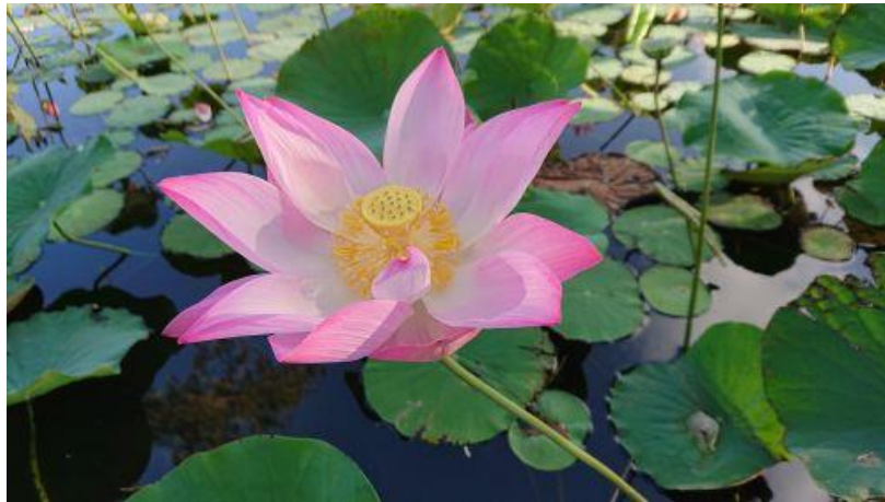
Hoa sen tại Khai Long (6)

Khi đến Đất Mũi, tôi vui mừng và thầm cảm ơn chị N.A. đã chọn khu du lịch Khai Long để đoàn dừng chân nghỉ đêm và tham quan. Khu du lịch này nằm trong một vùng đất rộng lớn với nhiều cây xanh, rạch nước, hồ sen hoa nở sắc màu.