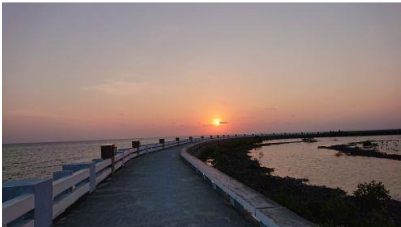
Hoàng hôn (6)

Chúng tôi dùng ca-nô tham quan rừng đước, các bãi đất phù sa trải dài như vô tận: