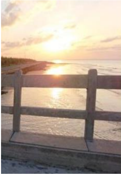
Bình minh (6)