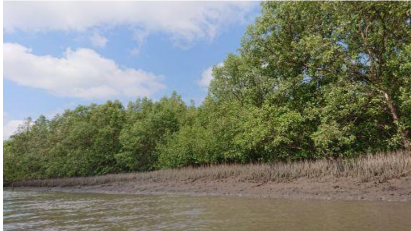
Cây mắm (6)

Khi đến Đất Mũi, tôi vui mừng và thầm cảm ơn chị N.A. đã chọn khu du lịch Khai Long để đoàn dừng chân nghỉ đêm và tham quan. Khu du lịch này nằm trong một vùng đất rộng lớn với nhiều cây xanh, rạch nước, hồ sen hoa nở sắc màu.