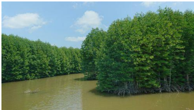
Rừng đước Đất Mũi (6)

Đoàn chúng tôi, sau khi tham dự buổi lễ khánh thành cầu mới ở Rạch Giá, đã đến xã Đất Mũi (xã tận cùng của cực nam Việt Nam). Về gần đến nơi tôi được chiêm ngưỡng khu rừng đước dài gần như vô tận với vô số các hàng cây đước, cây mắm đứng cạnh nhau, ngạo nghễ đón chào nắng ấm, len lỏi giữa những dòng nước phù sa. Rừng đước với tầng lá xanh mát, rễ dài, cắm sâu vào đất, giữ chặt đất không để nước biển cuốn đi. Khi hỏi người dân thì mới biết cây đước là loại có rễ cắm sâu xuống đất còn cây mắm có rễ hướng lên khỏi mặt đất.